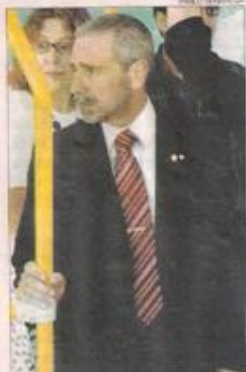
UNA MAS. Suma dieciocho acusaciones en su contra.